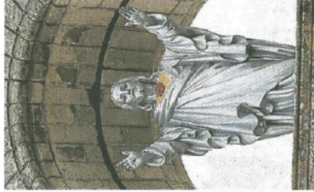
La statue remontée dans le campanile.

Mercredi 26 juillet, la statue restaurée du Sacré-Cœur a retrouvé le campanile de l'église Saint-Laurent d'Etiau.