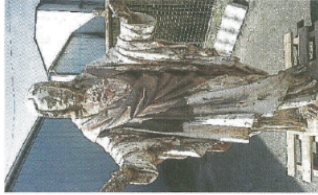
Le Sacré-Cœur avant sa restauration.